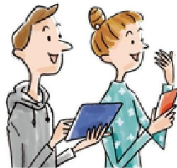
アパートWi-Fi導入物件の 入居者アンケート (2014年当社調べ)